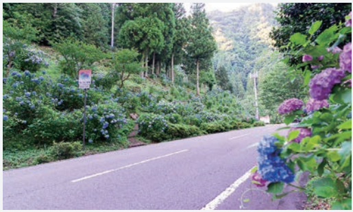
一里保木あじさい園