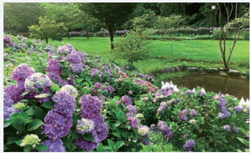
四季の森あじさい園