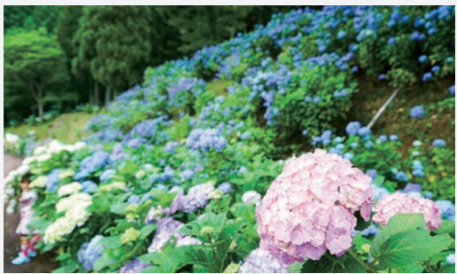
21世紀の森あじさい園